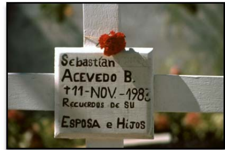
Tumba de Sebastián Acevedo, cerca de Concepción

Detrás de estas acciones se desarrolló un movimiento extraordinario, que tuvo la oportunidad de conocer en 1970, llamado "Movimiento contra la Tortura Sebastián Acevedo (MCTSA)". Movimiento que surge luego de que un padre en el año 1983, en la ciudad de Concepción, situada al sur de Chile, por desesperación se quemara a lo bonzo luego de haber buscado información sobre el paradero de sus hijos, durante todo el día en las dependencias de Carabineros. Situación que desencadenó en el ultimátum del hombre, quien anunció su muerte. Muerte que conmovió a todo el país y que originó el nombre del movimiento contra la tortura 2 .