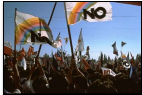
El 7 de octubre 1988, en el día del referéndum contra Pinochet, más de un millón de chilenos dieron gritos de júbilo por la victoria del NO en el Parque O'Higgins en Santiago.

En el mismo año, 1988, comenzó a desmoronarse el barro del coloso. En el referéndum de octubre, la mayoría de los chilenos no cedían ante las amenazas de Pinochet, que produjera un nuevo Golpe de Estado. Los chilenos y chilenas votaron por el NO, por el fin de la dictadura de Pinochet, por el fin de los asesinatos políticos, desapariciones y torturas. Al día siguiente más de un millón de personas celebraron en el Parque O´Higgins.