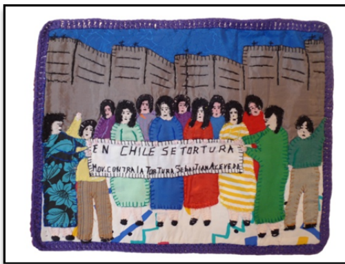
arpillera „Movimiento Contra la Tortura Sebastian Acevedo“ Lugar: Colección Museo Oshima Hakko, Japón