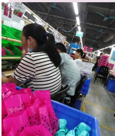
Fabrik Changan Mattel: Packstation für Accessoires der Color Reveal Barbie Puppe.