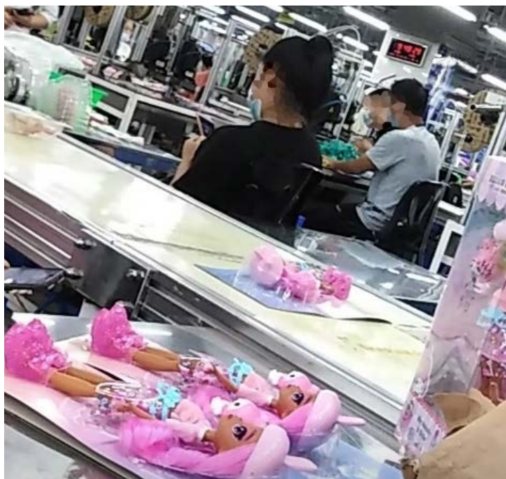
Rechts: Fabrik Changan Mattel: Produktion von Puppen.

Die COVID-19 Pandemie hat auch die Spielzeugindustrie und ihre Lieferketten getroffen. Der globale Verkauf von Spielzeugen hat jedoch zugenommen, da Eltern ihre Kinder, die zuhause bleiben und nicht zur Kita oder Schule gehen können, unterhalten müssen. Allein der Umsatz von Mattel ist um 10% gestiegen, der Gewinn hat sich sogar mehr als vervierfacht.