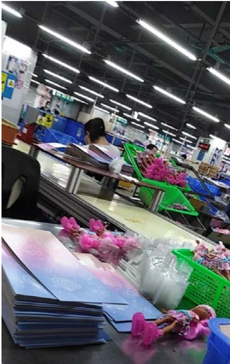
Fabrik Changan Mattel: Puppen-Montagestation.