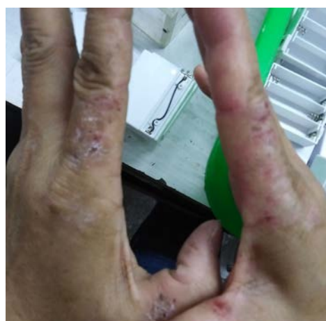
Mitte: Fabrik Dongyao: Kleben für Chiccos Traumspieluhr mit Nachtlcht (siehe Titelbild) — ohne Handschuhe, ohne Schutzmaske.