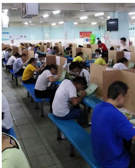
Fabrik Changan Mattel: mit Pappe gegen COVID-19 in der Kantine.

Die Fabrik von Dongyao hat keine Gewerkschaft und verlangt von den Beschäftigten während des Vorstellungsgesprächs ein Formular zu unterschreiben, das besagt, dass sie nicht beabsichtigen einer Gewerkschaft beizutreten. Gemäß Artikel 7 des chinesischen Arbeitsgesetzes haben die Beschäftigten jedoch das Recht, einer Gewerkschaft beizutreten oder eine Gewerkschaft zu gründen. Dongyao verfügt über eine Liste von Arbeitnehmervertreter*innen, aus der jede Abteilung ihre Vertreter*innen wählen kann. Aber nach Aussage einer Arbeitnehmervertreter*in finden Wahlen nur dann statt, wenn es für die Fabrik gerade günstig ist. Die Arbeitnehmervertreter*innen sind nur für die Verbreitung von Informationen aus der Fabrik verantwortlich (z.B. Änderungen der Arbeitszeiten). Sie kommunizieren aber nicht die Bedürfnisse und Probleme der Beschäftigten an die Fabrikleitung.